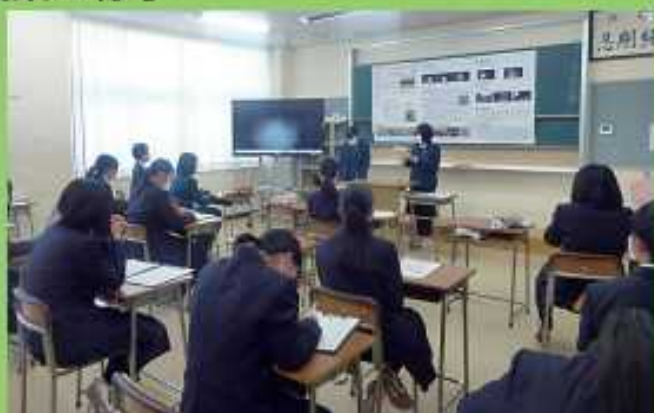
地域と連携した学習