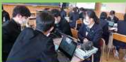
ICT機器を活用した学習