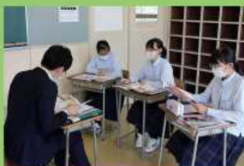
進路別ガイダンス