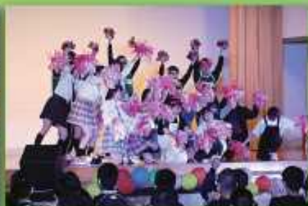
学校祭(十和田高校)