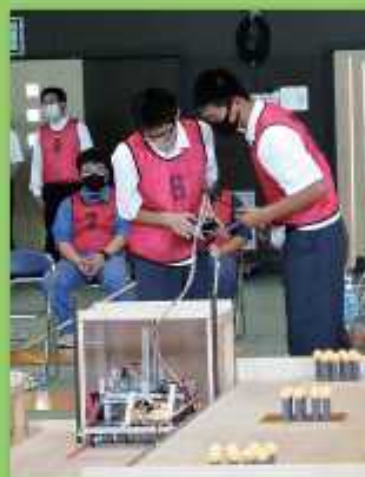
高校生ロボット競技大会