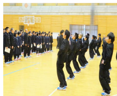
応援歌による歓迎