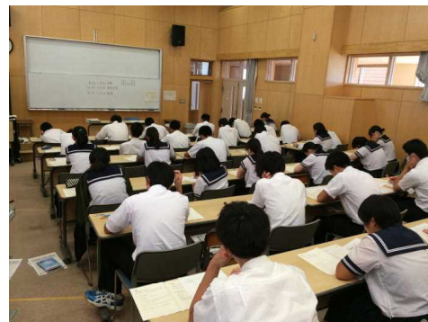
夏休みの課外の成果を試す