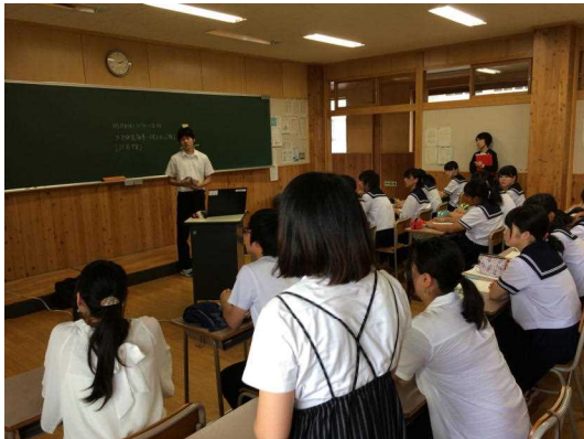
テーマ研究発表後に先輩のアドバイスを受ける

実際に経験したこともあり、非常にためになるアドバイスを頂くことができました。これをきっかけに今後も意識して、積極的に受験対策に取り組んで欲しいと思います。