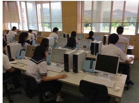
PCを用いた進路先の研究