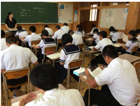
夏休みの学習の成果を点検

2年生は、「スタディーサポート」というツールを用いて、今現在の学力を点検しました。