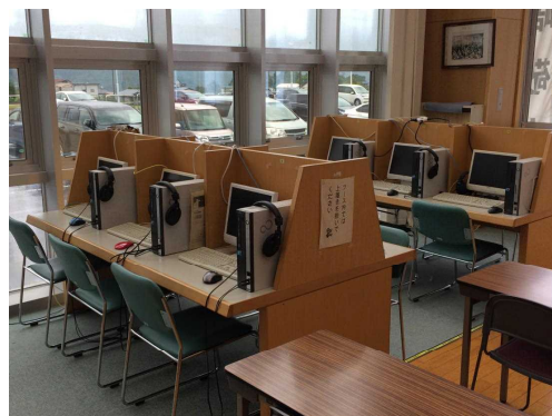
図書館に設置されたパソコン

また、ヘッドフォンを装備していますので、スタディーサプリやクラッシー(classi)の講義動画を、携帯電話などのデータ量の上限を気にすることなく受講することができます。積極的に利用してみてください。