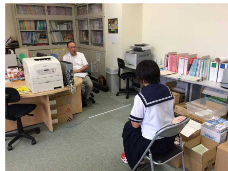
実戦に向けた面接練習の実施